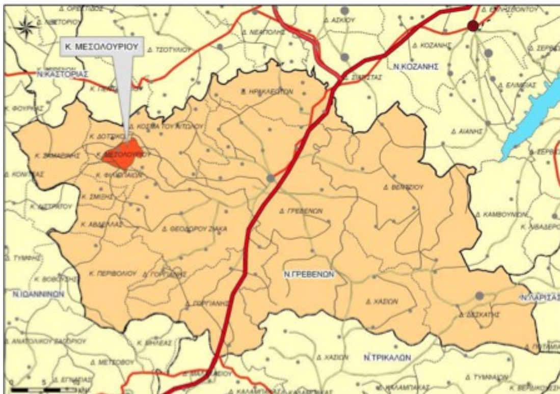
Χάρτης 9: Χωροταξική ένταξη Δ.Ε Μεσολουρίου στο Ν. Γρεβενών

Η Δημοτική Ενότητα Μεσολουρίου βρίσκεται στο βορειοδυτικό τμήμα του Νομού Γρεβενών και συνορεύει βορειοδυτικά με τη Δ.Ε Δοτσικού, νοτιοδυτικά με τη Δ.Ε Φιλιππαίων, νοτιοανατολικά με τη Δ.Ε Θεόδωρου Ζιάκα και βορειοανατολικά με τη Δ.Ε Αγίου Κοσμά. Η έκταση της Δ.Ε. Μεσολουρίου είναι περίπου 17.821 στρ. και η έδρα της είναι το Μεσολούρι (ο μοναδικός οικισμός της Δ.Ε.) που συγκεντρώνει το σύνολο του πληθυσμού.