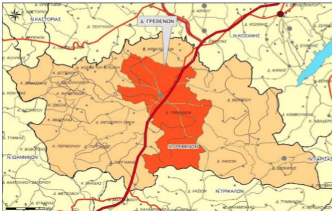
Χάρτης 1: Χωροταξική ένταξη Δ.Ε Γρεβενών στο Ν. Γρεβενών

Η Δημοτική Ενότητα Γρεβενών βρίσκεται στο κεντρικό τμήμα του Νομού Γρεβενών και συνορεύει δυτικά με τη Δ.Ε Θόδωρου Ζιάκα, βορειοδυτικά με τη Δ.Ε Κοσμά του Αιτωλού, βόρεια με τη Δ.Ε Ηρακλειωτών, ανατολικά με τη Δ.Ε Βεντζίου, νοτιοανατολικά με τη Δ.Ε Χασίων, νότια με το Νομό Τρικάλων και νοτιοδυτικά με τη Δ.Ε Γόργιανης. Η έκταση της Δ.Ε είναι περίπου 461,38 τ.χλμ. και έδρα της είναι η πόλη των Γρεβενών, που αποτελεί το παραγωγικό, οικονομικό και πολιτιστικό κέντρο όχι μόνο του Δήμου, αλλά ολόκληρου του Νομού, που συγκεντρώνει το 41,36% του συνολικού πληθυσμού, γεγονός που υποδηλώνει υπερσυγκέντρωση πληθυσμού και δραστηριοτήτων, σε αντίθεση με το υπόλοιπο του Νομού που χαρακτηρίζεται από διασπορά πληθυσμού και δραστηριοτήτων. Χαρακτηριστικό είναι το γεγονός ότι η περιοχή είναι από γεωμορφολογικής άποψης πεδινή και ημιορεινή. Από οικονομικής άποψης είναι καθαρά γεωργο-κτηνοτροφική, παρόλο που η φυσική της ομορφιά, οι εναλλαγές τοπίων, η μοναδική αξία του Εθνικού Δρυμού Β. Πίνδου, οι περιοχές απείρου φυσικού κάλλους προσφέρουν τις κατάλληλες προϋποθέσεις ανάπτυξης χειμερινού τουρισμού.