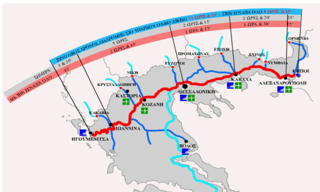
Σχήμα 1.1: Η Εγνατία Οδός

Η ολοκλήρωση της Εγνατία Οδού έχει συμβάλλει σημαντικά στον τομέα των εξαγωγών προϊόντων της περιοχής αλλά και της προσέλκυσης τουριστών, κυρίως κατά την χειμερινή περίοδο με την ανάδειξη του χειμερινού τουρισμού, καθιστώντας το Δήμο Γρεβενών έναν τουριστικά προσπελάσιμο προορισμό. Στο γεγονός αυτό συμβάλλει ότι η Εγνατία Οδός διότι λειτουργεί συγχρόνως ως συλλεκτήριος οδικός άξονας των πανευρωπαϊκών αξόνων μέσω της Βαλκανικής και της Ν.Α. Ευρώπης.