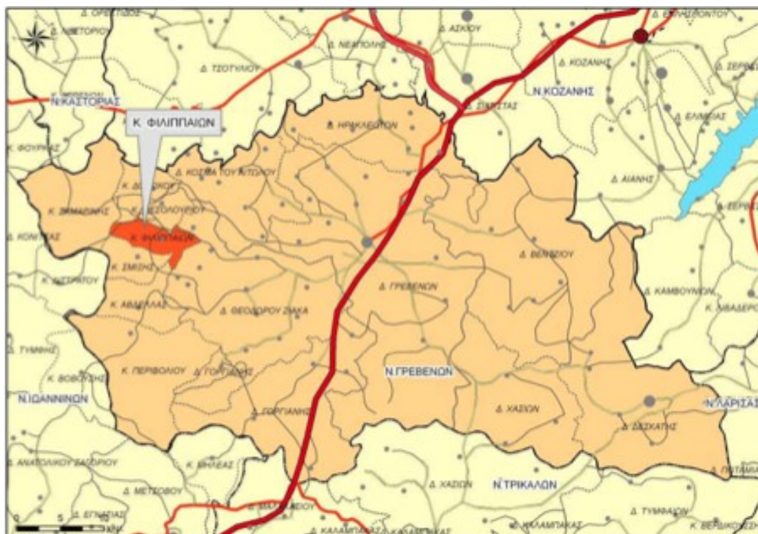
Χάρτης 13: Χωροταξική ένταξη Δ.Ε Φιλιππαίων στο Ν. Γρεβενών

Σύμφωνα με τα στοιχεία της ΕΛ.ΣΤΑΤ. κατά την απογραφή του 2011, ο μόνιμος πληθυσμός της Δ.Ε. Φιλιππαίων, ήταν 159 κάτοικοι και παρουσιάζει μείωση κατά 37,40% σε σχέση με τον πληθυσμό της πρώην κοινότητας Φιλιππαίων που σύμφωνα με τα στοιχεία της απογραφής του 2001, ήταν 254 κάτοικοι.