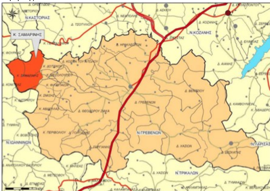
Χάρτης 11: Χωροταξική ένταξη Δ.Ε Σαμαρίνας στο Ν. Γρεβενών

Το 1918 συστάθηκε με το ΦΕΚ 260Α - 31/12/1918 η Κοινότητα Σαμαρίνης με έδρα τον οικισμό Σαμαρίνα, κοινότητα η οποία ανήκε στο Νομό Κοζάνης. Με το ΦΕΚ - 16/10/1940 αναγνωρίζεται ο οικισμός Λυκοκρέμασμα και προσαρτάται στην Κοινότητα, οικισμός ο οποίος, ωστόσο, καταργείται στη συνέχεια με το ΦΕΚ - 07/04/1951. Το 1964 (ΦΕΚ 185Α - 30/10/1964), η Κοινότητα υπάγεται στο Νομό Γρεβενών, ενώ το 2008 μετονομάζεται σε Κοινότητα Σαμαρίνας. Σύμφωνα με τον Ν.3852/2010 (ΦΕΚ 87/07-7-2010) «Νέα Αρχιτεκτονική της Αυτοδιοίκησης και της Αποκεντρωμένης Διοίκησης – Πρόγραμμα Καλλικράτης», η πρώην κοινότητα Σαμαρίνης συγκροτείται πλέον σε Δημοτική Ενότητα (Δ.Ε) Σαμαρίνης του Καλλικρατικού Δήμου Γρεβενών, η οποία αποτελείται από την Τοπική Κοινότητα Σαμαρίνης.