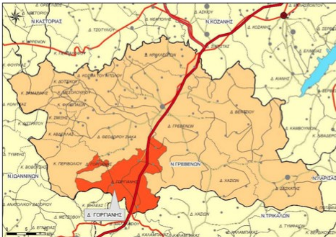
Χάρτης 3: Χωροταξική ένταξη Δ.Ε Γόργιανης στο Ν. Γρεβενών

Η Δημοτική Ενότητα (Δ.Ε) Γόργιανης βρίσκεται στο νοτιοδυτικό τμήμα του Νομού Γρεβενών και συνορεύει δυτικά με τη Δ.Ε Περιβολίου, βορειοδυτικά με τη Δ.Ε Θεόδωρου Ζιάκα, ανατολικά με τη Δ.Ε Γρεβενών, νοτιοανατολικά με το Νομό Τρικάλων και νοτιοδυτικά με το Νομό Ιωαννίνων. Η έκταση της Δ.Ε ανέρχεται σε 210 χιλιάδες στρέμματα περίπου και έδρα του είναι το Κηπούρειο που συγκεντρώνει το 25,60% του συνολικού πληθυσμού. Γεωμορφολογικά, η περιοχή της Δ.Ε είναι ορεινή με εξαίρεση την περιοχή της Πηγαδίτσας.