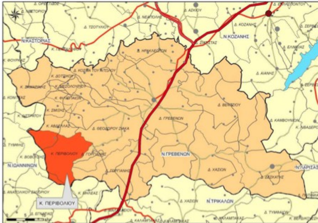
Χάρτης 10: Χωροταξική ένταξη Δ.Ε Περιβολίου στο Ν. Γρεβενών

Μελετώντας τη διοικητική αναδιάρθρωση της πρώην Κοινότητας Περιβολίου, διαπιστώνεται ότι συστάθηκε το 1918 (ΦΕΚ 260Α - 31/12/1918) ως τμήμα του Νομού Κοζάνης με έδρα τον οικισμό Περιβόλι, ενώ στη συνέχεια το 1964 (ΦΕΚ 185Α - 30/10/1964) η Κοινότητα υπάγεται στο Νομό Γρεβενών. Σύμφωνα με τον Ν.3852/2010 (ΦΕΚ 87/07-7-2010) «Νέα Αρχιτεκτονική της Αυτοδιοίκησης και της Αποκεντρωμένης Διοίκησης – Πρόγραμμα Καλλικράτης», η πρώην κοινότητα Περιβολίου συγκροτείται πλέον σε Δημοτική Ενότητα (Δ.Ε) Περιβολίου του Καλλικρατικού Δήμου Γρεβενών, η οποία αποτελείται από την Τοπική Κοινότητα Περιβολίου.