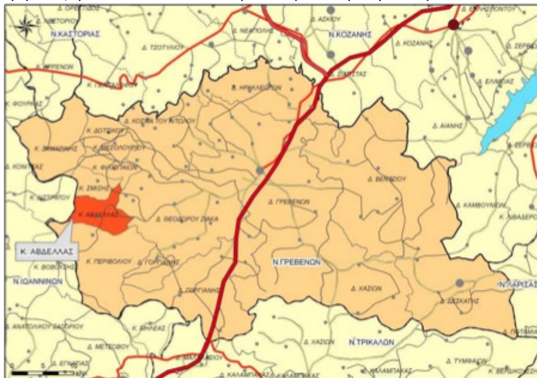
Χάρτης 7: Χωροταξική ένταξη Δ.Ε Αβδέλλας στο Ν. Γρεβενών

συγκροτείται πλέον σε Δημοτική Ενότητα (Δ.Ε) Αβδέλλας του Καλλικρατικού Δήμου Γρεβενών, η οποία αποτελείται από την Τοπική Κοινότητα Αβδέλλας.